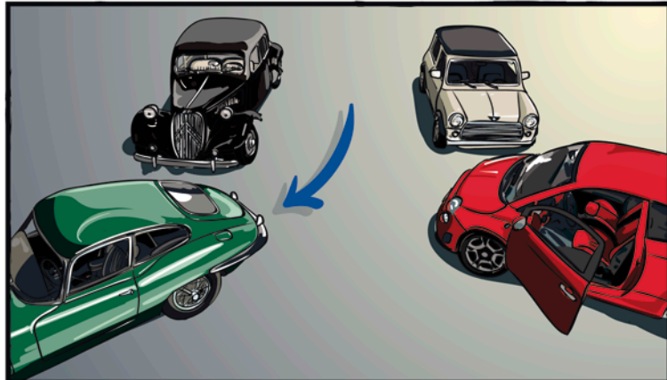
Fahren Sie das Mietfahrzeug aus der Parklücke