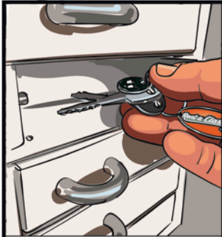
Entnehmen Sie die RaC-Fahrzeugschlüssel