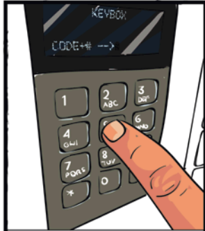
Code eingeben aus Bestätigungs-E-Mail

Sie haben ein klassisches Fahrzeug von Rent a Classic gemietet und kommen mit Ihrem Fahrzeug? Wenn Sie die untenstehenden Parkanweisungen befolgen, machen Sie alles richtig, vermeiden Ärger und können Ihre Ausfahrt sorglos genießen.