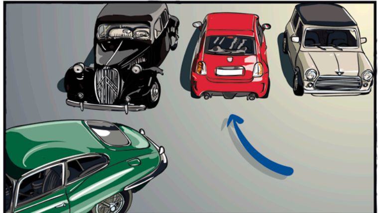
Parkieren Sie Ihr privates Auto NUR auf dem Platz, auf dem IHR Klassiker stand , auch wenn andere Parkplätze frei sind