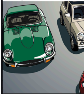
Gehen Sie zu Ihrem Mietfahrzeug